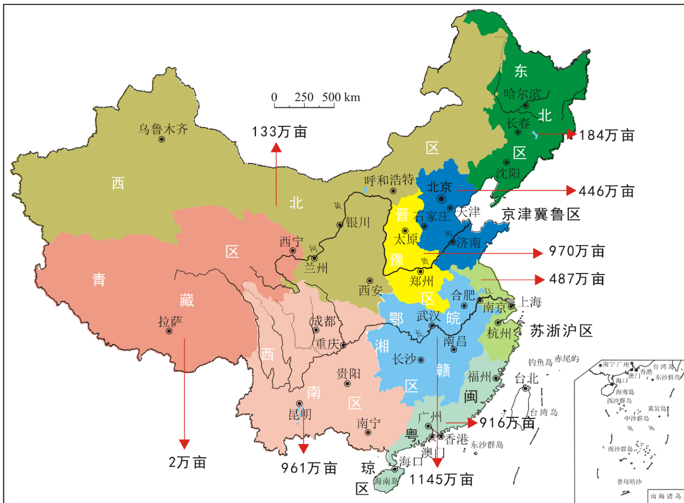
图 1 全国绿色富硒耕地分布图